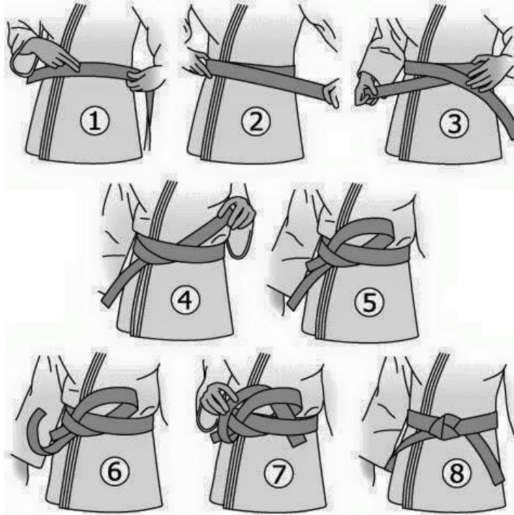
Le deuxième nœud présenté dans la vidéo